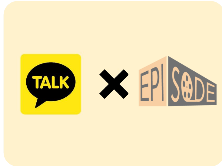
카카오톡 오픈채팅방 “아주대학교 e-비즈니스학과 공지방”