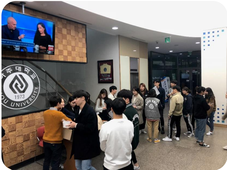
중간·기말고사 간식 사업