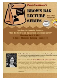
사진. 세계 명문 대학 및 공공기관의 BBL 포스터