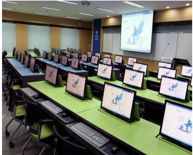
사진. 아주고전 BBL이 열리는 성호관 303호 ACE 강의실

아주고전 BBL은 11월에 열리게 될 <아주 위대한 고전경연대회>와 함께, 우리 대학 학생들에게 인문의 지적 유산이지만 접근하기 까다로운 고전을 "어떻게 읽을 것인가" 하는 물음에, 아주 구체적이면서도 실질적인 고전 독해법을 제공할 수 있기를 기대합니다.